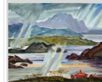
Ю. Васильев. «Фьорды, фьорды». 1996

по размеру картины отличает сдержанная цветовая палитра, монументальность, реалистичность изображения пространства Севера.