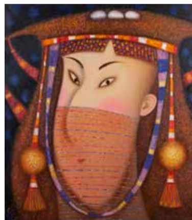
«Тихий шепот». 2009