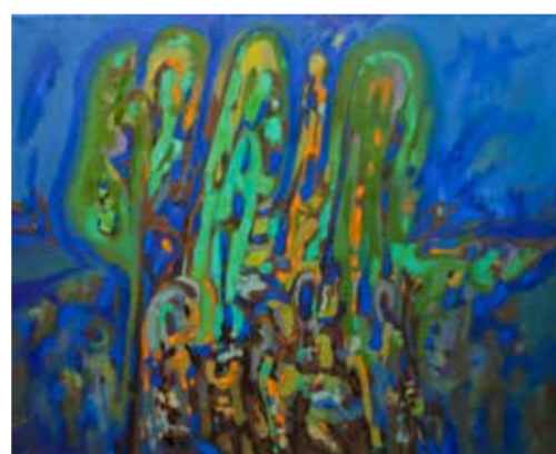
А. Жуков. «Три дерева». 2013