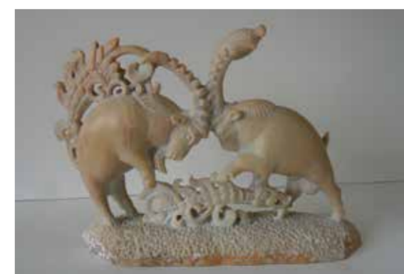
О. Мажа. «Поединок». 2013