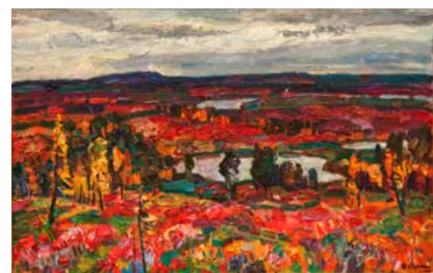
В. Сергин. «Заполярье. Краски сентября». 2012