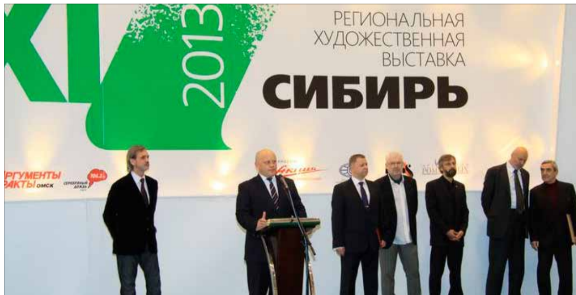
Выставку открывает губернатор Омской области В. Назаров

Выставка «Сибирь-ХI», свободно раскинувшаяся на шести тысячах квадратных метров Областного Экспоцентра, дает возможность почувствовать силу и мощь сибирских просторов, от Забайкалья до Омского Прииртышья. На живописных полотнах сибиряков предстают образы степной (Забайкалье и Прибайкалье, Алтайская нива, Западно-Сибирская и Тувинская степь), горной (Саяны, Алтай, Кузнецкое Алатау), морской и речной (Красноярский и Томский север, Байкал, Телецкое озеро, Енисей, Иртыш), таёжной Сибири. Портреты мужественных и полных достоинства наших современников и исторических деятелей получили свое отражение в произведениях живописи, графики, скульптуры. Сибирь традиционно богата природными ресурсами, порой уникальными, которые служат материалом для художников прикладного и монументального искусства: изделия из серебра, нефрита, агальматолита, серпентинита, мрамора, конского и сарлычьего волоса дают изумительную картину изобразительного и прикладного искусства современной Сибири. Архитектур-