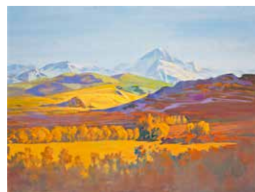
И. Налабардин. «Осень в горах». 2010–2012