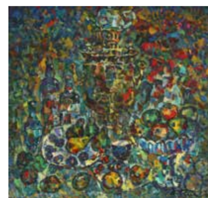
И. Филичев. «Старый самовар, старое вино и фрукты». 2012

куств, фольклорного ансамбля «Звонница», Омского областного колледжа культуры и искусств, камерного ансамбля «Музет», концерты-презентации и т.д. О содержании этой обширной программы сообщается на огромном баннере у входа на выставку, где зрителей встречают волонтеры, помогающие посетителям сориентироваться в большом выставочном пространстве и выполняющие другие поручения организаторов.