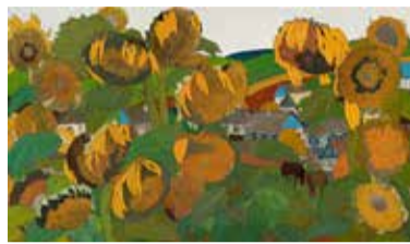
«Конец августа. Подсолнухи». 2009