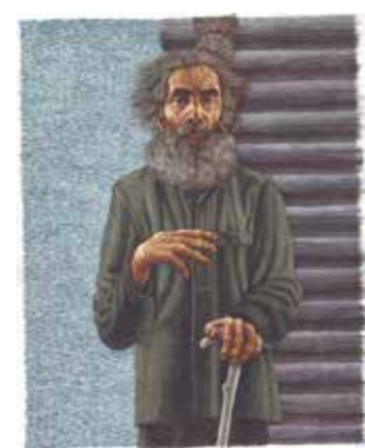
С. Элянов. «Прощание с Матерой». 2011. Бум., акв. 27X21, 25 илл.