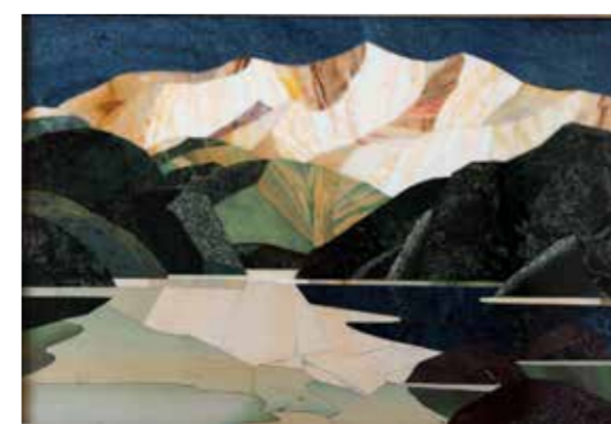
А.Суслов. «Золотой Борус». 2011