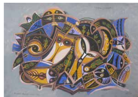
С. Дыков. «Чужая Земля»