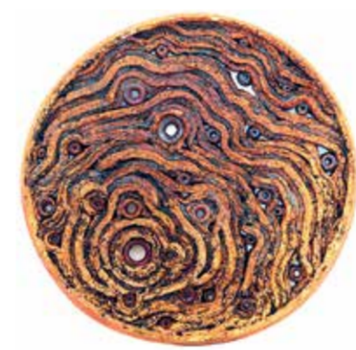
Н. Мещерякова. «Пробуждение». глина, глазури, оксиды, соли, ангобы

Выставка «Сибирь XI» будет работать до 10 ноября 2013 года. искусствоведение в Сибири» состоятся 26-27 октября.