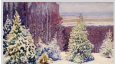
А. Борисов. «Виды с дачи на окрестности зимой». 1910. Архангельский художественный музей

Формулируя основную цель выставочного проекта, организаторы говорили о необходимости привлечения внимания к особенностям Арктики, ее культурным и экологическим составляющим, о задаче воспитания осмысленного и ответственного отношения людей к освоению этого региона. Живописцы и графики своими работами показали на выставке все грани красоты удивительного природного мира Ямала.