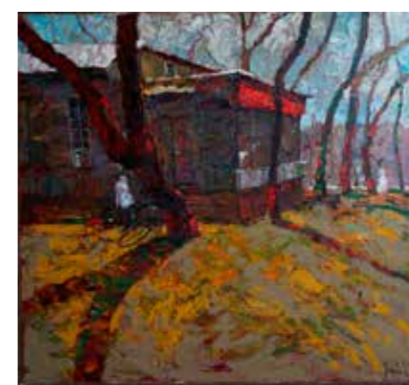
Е. Боброва. «Встреча». 2012