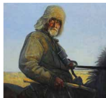
А. Гнилицкий. «Встречный». 2012