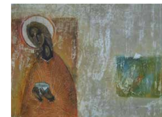
А. Машанов. «Уголи моя печали». 2011