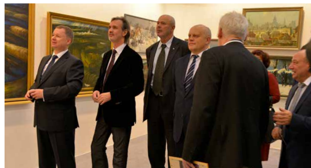
В залах выставки