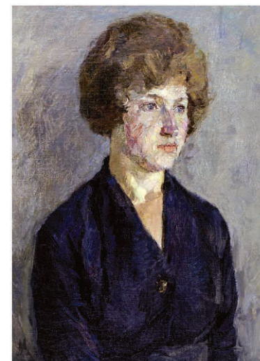
«Портрет девушки в синем платье». 1961