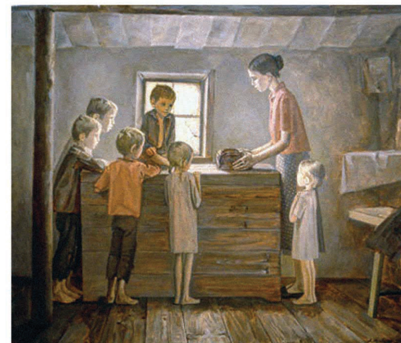
«Хлеб войны». 1985-1999. Частное собрание