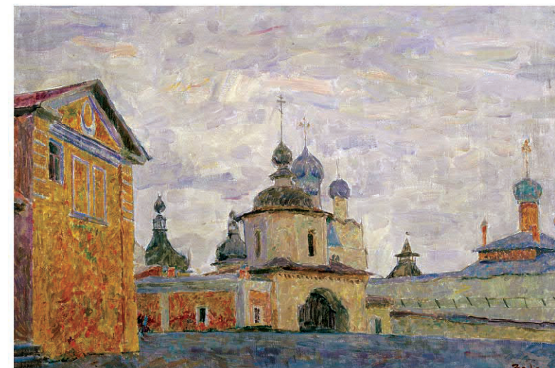
«Ростов Великий». 1967

В выставочном зале на Покровке, 37 было представлено более 50 работ из собрания СХР, коллекции галереи «Арт Прима» и частных собраний. Незабываемо яркую живопись Вячеслава Николаевича Забелина относят к импрессионизму, но такому своеобразному, к которому пришло определение «русский». Импрессионизм в Европе постепенно превратился в почти рецептурное искусство, и только