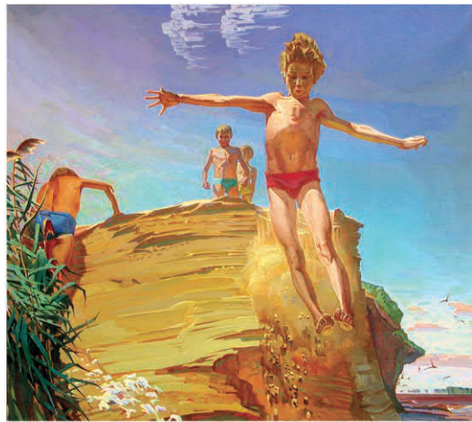
«Над Амуром. Детство». 1984. Картинная галерея им. А. М. Федотова (г. Хабаровск)