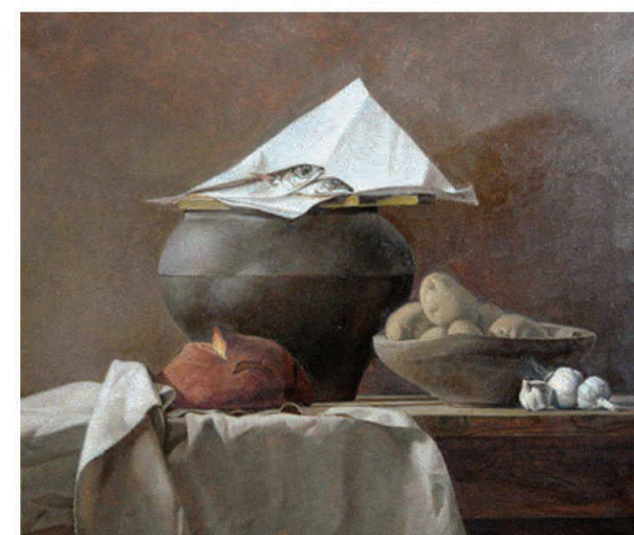
«Натюрморт с чугуном». 1991. Галерея Арт Прима