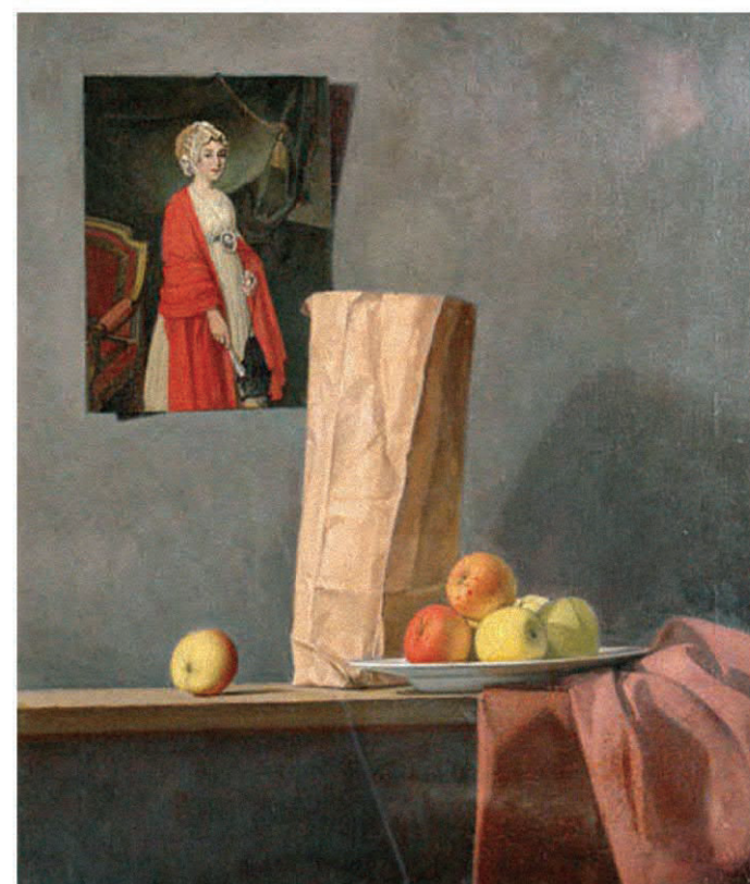
«Хлеб войны». 1992. Галерея Арт Прима