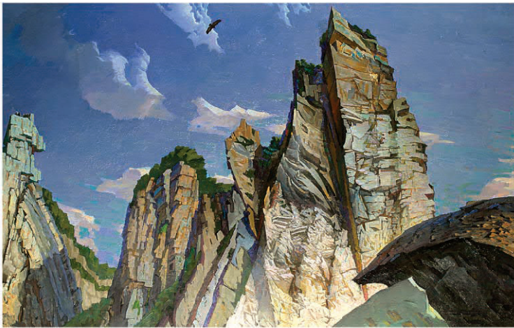
«Орлиный клекот». 1986. Собственность автора