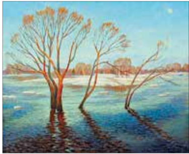
«Весенний разлив». 1987

Выставка живописи, графики и монументального искусства из фондов Брянского областного художественного музейно-выставочного центра и собрания семьи, посвященная 75-летию со дня рождения Виктора Менькова, открылась в Брянском областном художественном музейно-выставочном центре.