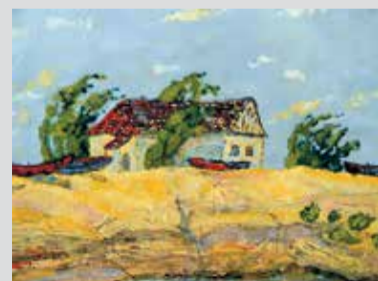
«Домик у тихой гавани»