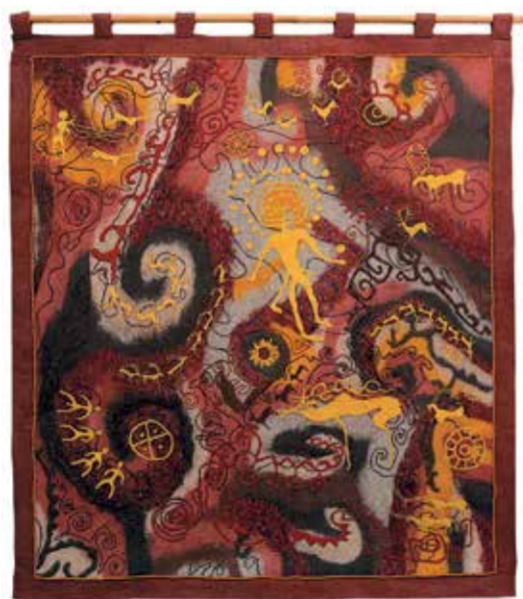
Ф. Шейшева. «Гора архаров». 2010