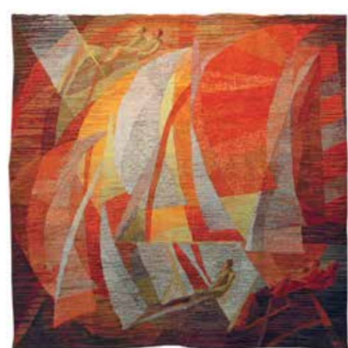
Э. Тамперер. «Пламя соревнования». 1979