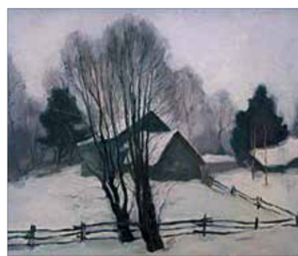
В. Виханский. «Мокрый день». 1979