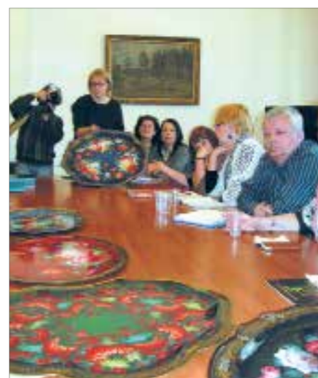
Заседание комиссии по народному искусству