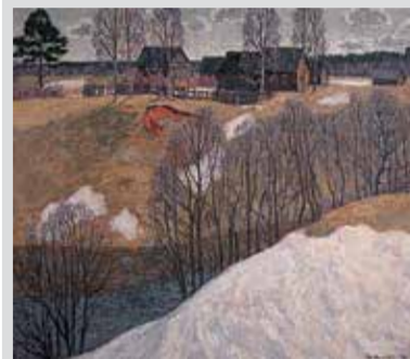
«Последний снег». 1976