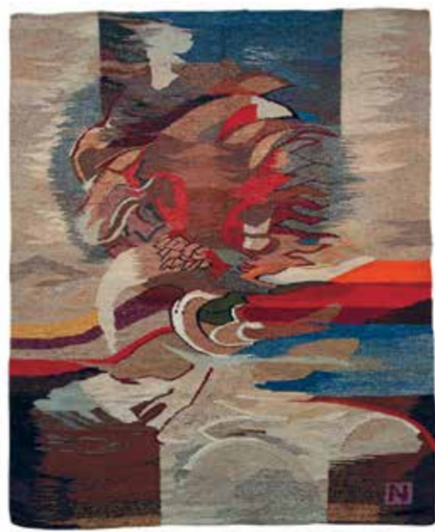
А. Негура. «Вихрь». 1994

суицида. Для них рисование не просто арт-терапия — шанс на нормальную жизнь.