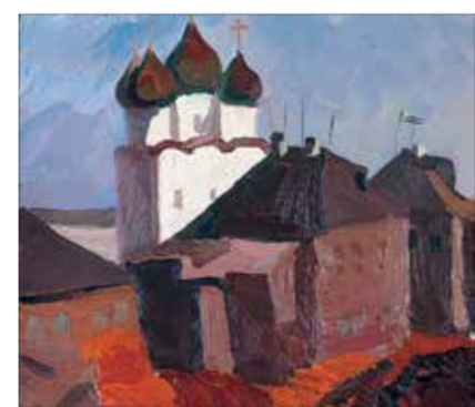
И. Виханский. «Карпополь». 2003