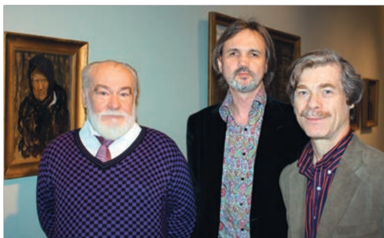
Телин среди друзей и соратников

всеобщее счастье, где все люди любят друг друга, где не смотря на горести и трудности все обязательно закончится хорошо.