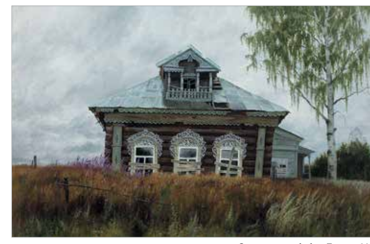
«Здесь жила бабка Липа». 2007