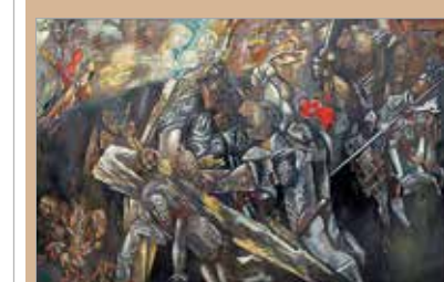
«Несение креста». 2000