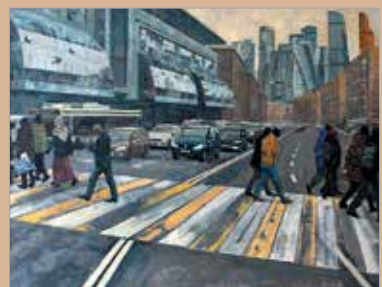
Д. Антонова «На разделительной полосе». 2016

Первое, что приходит на ум при просмотре экспозиции, это то, что динамичная и в то же время завершённая картина мира этих живописцев принадлежит, безусловно, нашей реальности, что общим для них является принадлежность к современности. В городских видах, бытовых зарисовках Антонова и Гаврилова создают «портрет» среды обитания современного человека, при этом стремясь уйти от повседневности в область свободного самовыражения. Они сопричастны нашему времени, со-