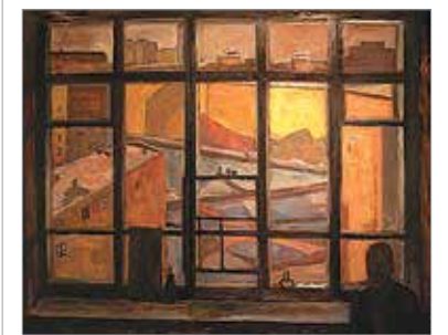
«Окно в мастерской». 2013

Первая персональная выставка молодого художника демонстрирует приверженность автора лучшим тра-