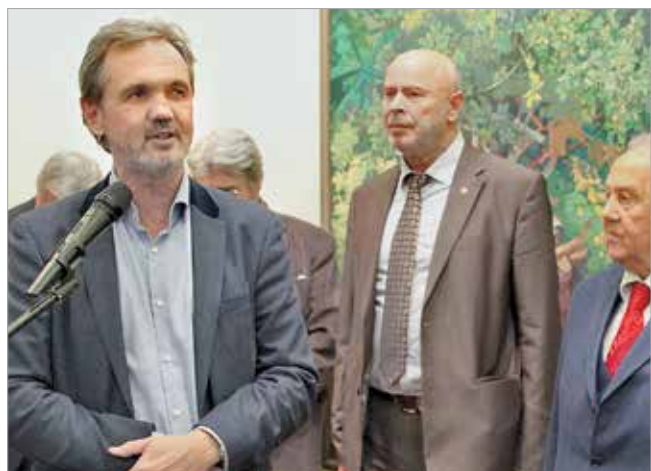
Выступает Председатель Союза художников России А.Ковальчук