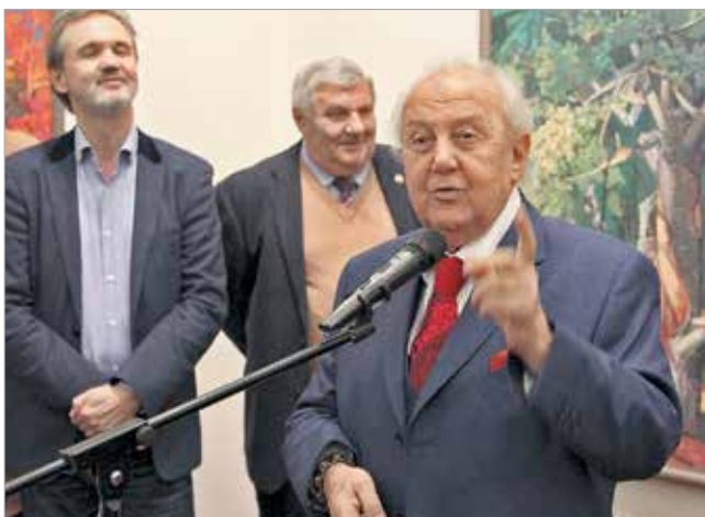
Высупает Президент Российской академии художеств З.Церетели