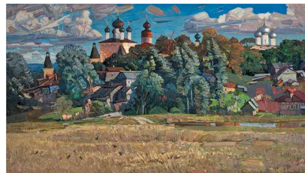
«Вид на Борисоглебский монастырь (Яр. обл.)». 2011

Мастерство художника в зените, он блестяще владеет арсеналом классического искусства. Дай Бог ему святого творческого непокая в поисках вечно ускользающего совершенства и смелости всегда быть самим собой.