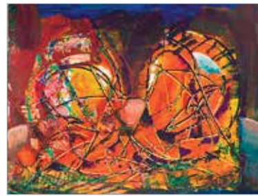
«Осенний дневник». 2013

заслуженного художника РФ, академика Российской академии художеств Виктора Калинина, к 70-летию со дня рождения и 50-летию творческой деятельности.