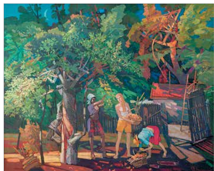
«Спас яблочный». 2013

возрождения. Его деревья страдают, радуются, им холодно или весело, они смотрятся в воду, как записные красавицы в зеркало, или застыли в зимнем оцепенении. Порой яблонь-героини позируют на просцениуме жизни, а небо структурируется с людьми: «Яблоня», «Луч в саду», а то и просто «Две сестры» и «Портрет старой яблони». Осочеловеченность пейзажа и невероятная хрупкость этой вечной красоты – подлинный сюжет пейзажной живописи Н.И. Боровской. Преданный палатин традиционной станковой картины, художник несовершенен, как шум яблонь, которые он так любит писать.