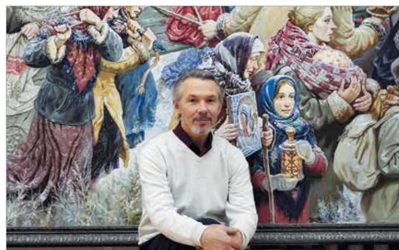
Заслуженный художник России Виктор Бычков