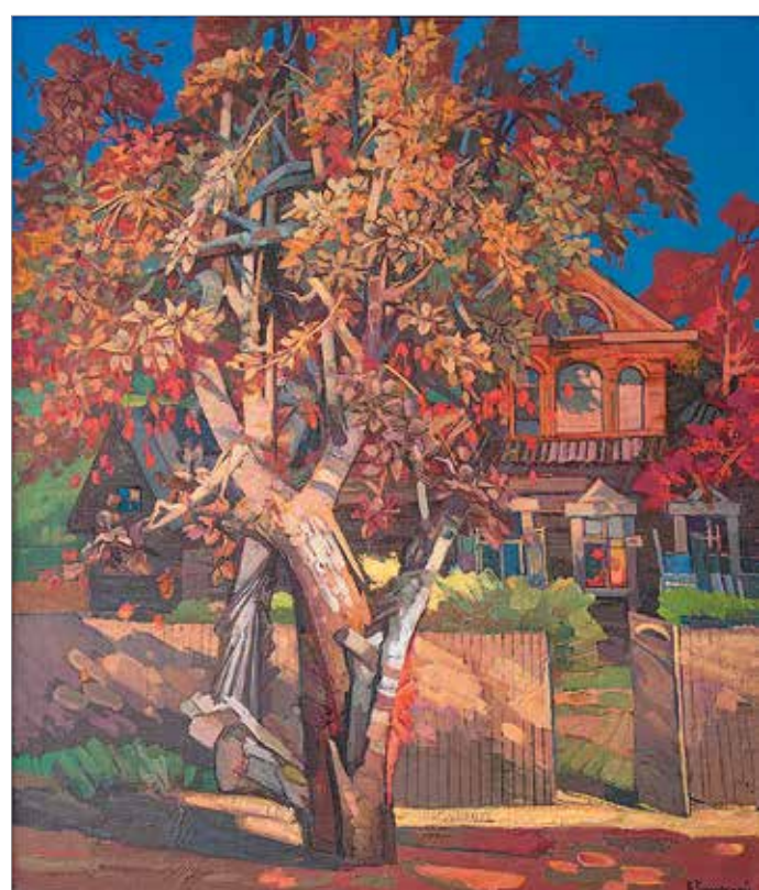
«Осень в деревне». 2010

По большому счёту традиционная станковая живопись не умерла вовсе не из-за присущих творчеству её адептов пластических изысков или экспериментов с фактурами, хотя это и очень важно для самих художников. Ни приёмы, ни техника письма, ни уточнённая или яркая декоративность колорита, ни игра с фактурами не могут сохранить классическую школу сами по себе, но лишь только настоящие подвижники, обладающие пассивной энергией творца и большим личностным масштабом по-настоящему