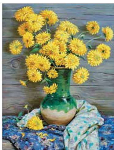
«Золотые шары». 2016