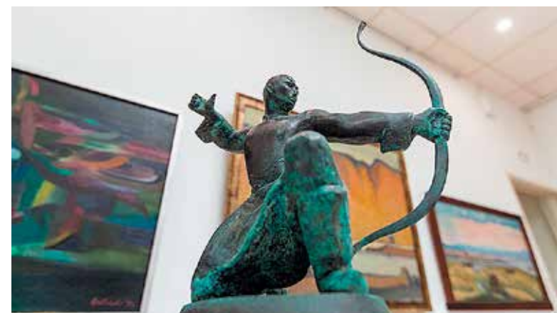
Один из экспонатов выставки

НА НАШЕЙ ПЛАНЕТЕ РОССИЯ ЗАНИМАЕТ 1/6 ЧАСТЬ ВСЕЙ ЗЕМНОЙ СУШИ. НА ЕЁ ТЕРРИТОРИИ ПРОЖИВАЮТ ПРЕДСТАВИТЕЛИ СТА ВОСЬМИДЕСЯТИ ДВУХ НАЦИОНАЛЬНОСТЕЙ. БЛАГОДАря ГРАМОТНОЙ ПОЛИТИКЕ РУКОВОДСТВА СТРАНЫ ВСЕ НАЦИОНАЛЬНОСТИ ИМЕЮТ ВОЗМОЖНОСТЬ РАЗВИВАТЬ СВОЮ СОБСТВЕННУЮ КУЛЬТУРУ И ИСКУССТВО, СОХРАНЯТЬ ОБЫЧАИ И ТРАДИЦИИ.