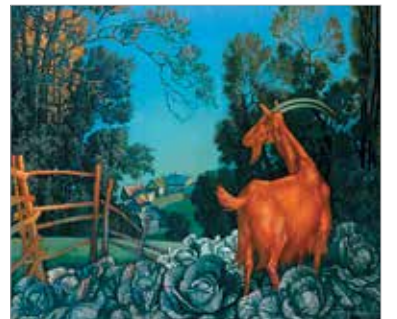
«Вечер в деревне»

дарственный художественный институт им. В.Сурикова (мастерская А.А.Дейнеки, Д.Д.Жилинского). В 1967 г. – первая премия на Всесоюзной выставке. В 1979 г. присуждена серебряная медаль Академии художеств СССР. В 1981 г. присуждена серебряная медаль ВДНХ СССР. В 2004 г. – медаль «За большой личный вклад в укрепление могущества и славы России». Участник городских, областных, зональных, республиканских, всесоюзных, международных, всемирных выставок. Работы хранятся в Государственной Третьяковской галерее, Государственном Русском музее Санкт-Петербурга, Киевском музее русского искусства, Оренбургском музее ИЗО, музеях Запорожья, Красноярска, Краснодар, в частных коллекциях Германии, Франции, Финляндии, США и т.д.