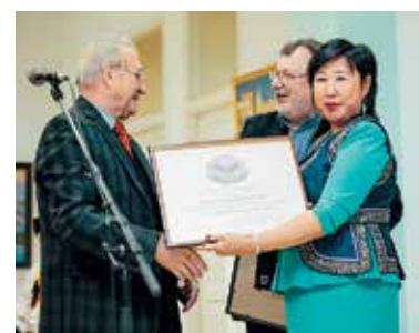
Вручение Благодарности РАХ национальному музею Республики Бурятия

вой историй отличает удивительное вживание в образы человека, животного или предмета. Как и у других малых народов РФ, в Бурятии на протяжении многих веков существует эпос «Гэсэр», которому художники также уделяют немало внимания. Можно с уверенностью утверждать, что всё искусство бурятских художников направлено на дальнейшее развитие культуры и повышение эстетического уровня жителей этой прекрасной страны. Следовательно, вклад бурятских художников во всё изобразительное искусство России очень значителен и служит связующим звеном в укреплении дружбы между народами нашей многонациональной страны.