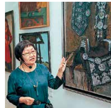
Экскурсия по выставке

Ярким представителем одной из национальностей России является Республика Бурятия, занимающая огромную территорию, которая простирается от озера Байкал до Приморского края.