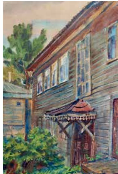
«Ровесник прошедшего века»

В ноябре 2016 года в гимназии состоялась открытие выставки акварелей профессора МГХПА