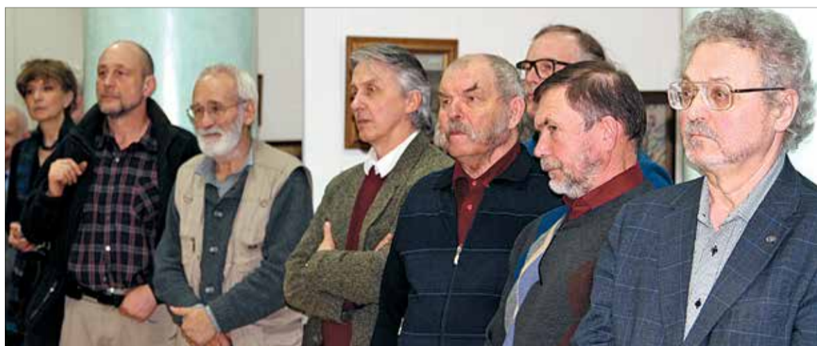
Художники России на открытии выставки

которые до него, кажется, не открывались никому: «Первая зелень. Стадо», «Подснежники. Осинник» (ГТГ) с их неяркой одухотворённой красотой.