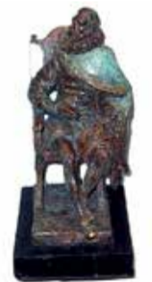
С. Кулигин. «Сервантес»