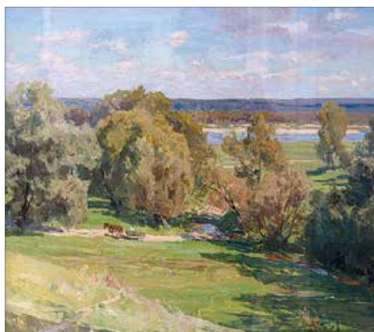
«Летний день на Оке». 1976