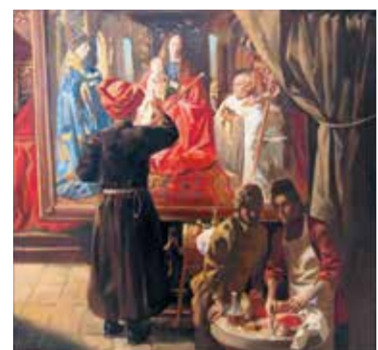
В. Каджаев. «В мастерской Ван Эйка», 2015