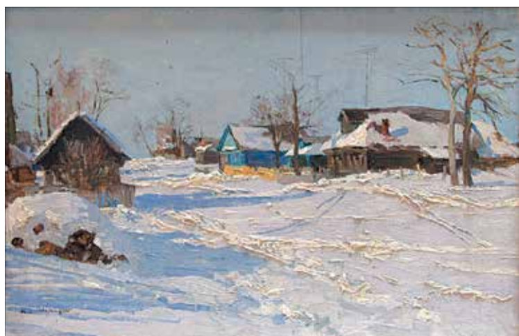
«Мартовское солнце». 1962