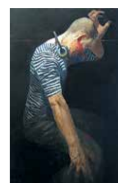
Д. Колистратов. «Акустик»