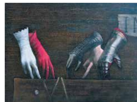
В. Пухаев. «Мизансцена», 2015