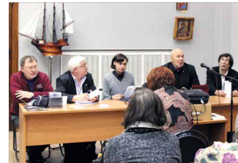
Заседание круглого стола по итогам выставки «Искусство помогает жить»

Всероссийский конкурс изобразительного искусства в уголовно-исполнительной системе (УИС) был организован Общественной организацией «Попечительский совет уголовно-исполнительной системы», Союзом художников России и Владимирским юридическим институтом ФСИН России при содействии Федеральной службы исполнения наказаний России и проводился под девизом «Искусство помогает жить».