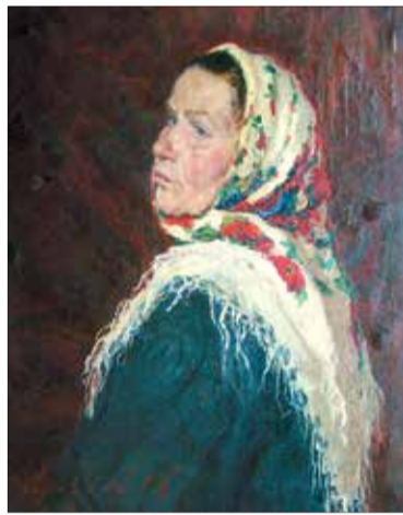
«Портрет колхозницы». 1956

В. Воробьев родился 15 марта 1925 г. в Казани. Во время Великой Отечественной войны В. Воробьев воевал на фронте в артиллерии. После войны он закончил Казанское художественное училище и поступил на живописный факультет Ленинградского института живописи, скульптуры и архитектуры имени И.Е. Репина, с отличием его окончил. В 1956 г. В. Воробьев переехал в Брянск. В этот период художник участвовал в выставках различного уровня. В 1960 г. вступил в Союз художников СССР.