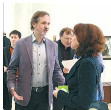
В залах выставки