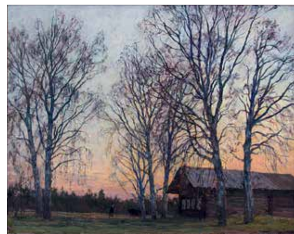
«Осенний вечер. Берёзы обнажились». 1983–1984