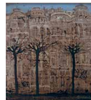
А. Есенов. «Брюссель», 2015