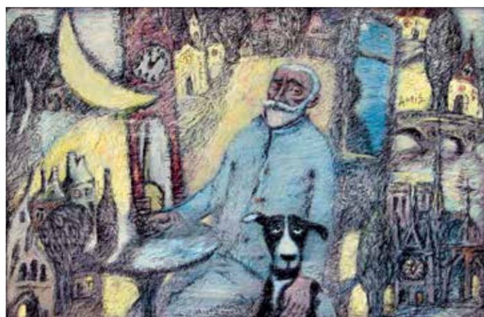
Ю. Абисалов. «Друзья», 2010. Из серии «Прогулки по старой Испании»