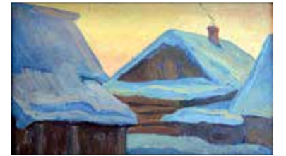
«Морозное утро». 1996