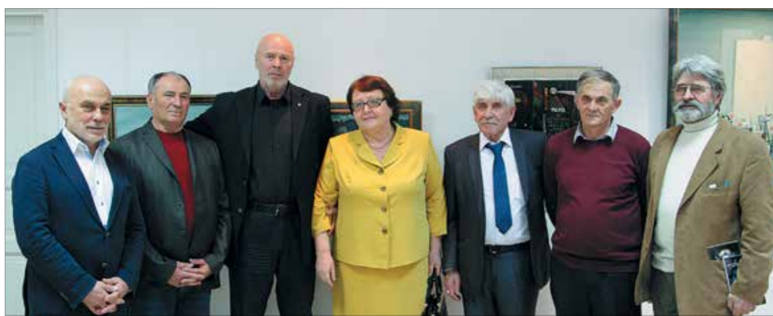
Гости и участники выставки

Европа во все времена притягивала к себе художников из России. Не обошли ее своим вниманием и современные мастера осетинской живописи. Учитывая глубокую осетинскую индивидуальность, самобытность, бережное отношение художника к традициям национальной культуры, благодаря встречам с богатой историей и культурой Европы творческий уровень наших мастеров значительно возрос. Поэтому организовывать «Дни осетинской культуры в Европе», пятый год подряд основу которых составляют выставки художников из Осетии, стало для кураторов и участников большой честью, серьезным вызовом и своеобразной миссией.