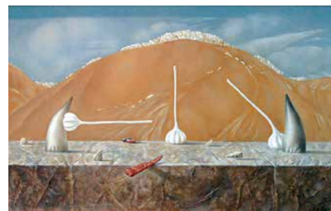
О. Басаев. «Равновесие», 2014