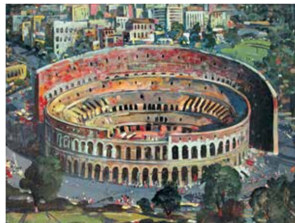
М. Келехсаев. «Копизей. Рим», 1986