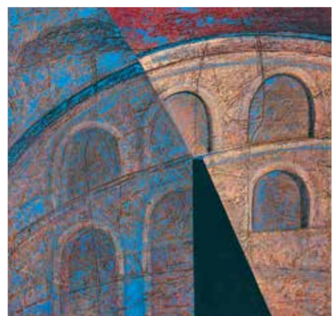
В. Айларов. «Копизей – II», 2015

Многогранность творчества мастера охватывает практически все жанры живописи, в том числе и пейзаж, который представлен на выставке произведениями «Кафе в Которе» и «Улочка в Которе», погружающими зрителя в наполненную солнцем и мягкой игрой светотени атмосферу курортного средиземноморского городка.