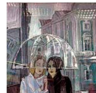
Е. Воронов. «Подруги»