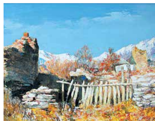
Л. Касоев. «Осень в горах», 2015