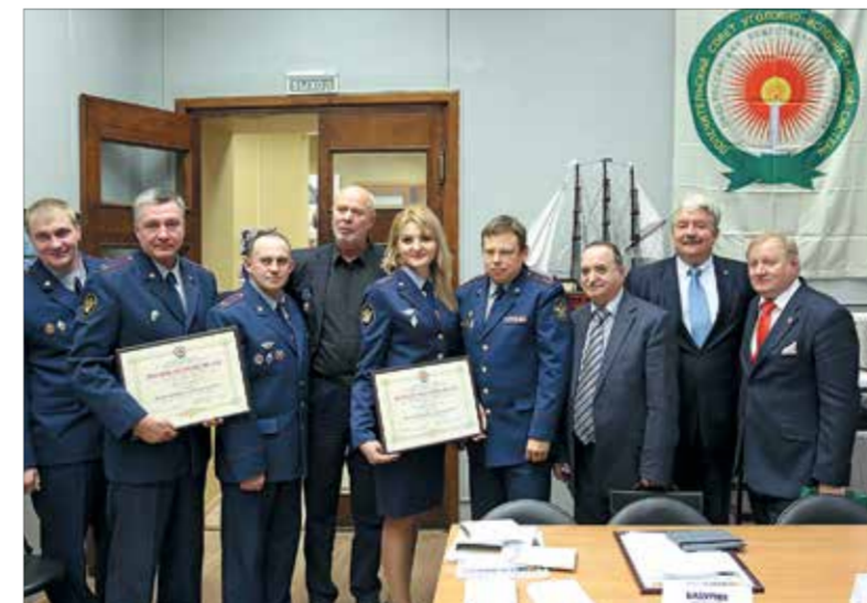
Вручение дипломов сотрудникам ФСИН России на открытии выставки

Выставка победителей и участников всероссийского конкурса изобразительного искусства среди осужденных (живопись, декоративно-прикладное искусство, игрушка).