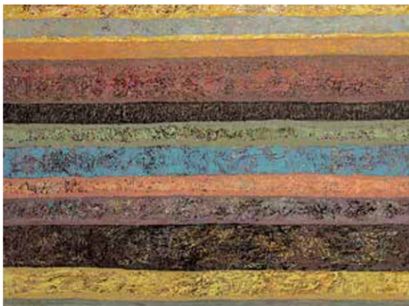
Р. Каркусов. «Горизонты – II», 2012