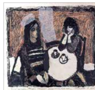
З. Абисалова. «Мелодия тишины 1»