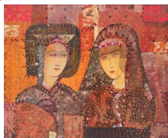
А. Грип. «Две одалиски»