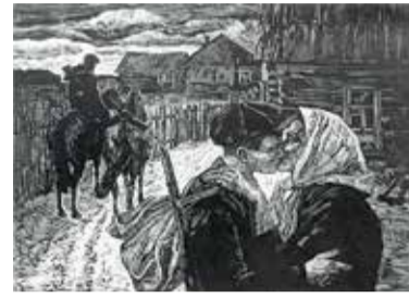
Е. Антонов. «В партизаны» 1969

Е.Н. Антонов родился 22 июля 1925 г. в Смоленске. После окончания Пензенского художественного училища им. К.А. Савицкого в 1955 г. про-