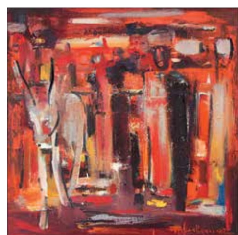
А. Шарловский. «Восточный базар»

При просмотре экспозиции нередко возникает сравнение с подобными выставками, которые проводились МОСХом в 50-60-е годы XX столетия. Отрадно отметить, что