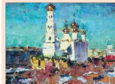
В. Мурашко. «Строится собор». 2015

Выставка, посвящённая 1030-летию города Брянска и Всемирному дню окружающей среды, проходила в Брянском областном художественном музейно-выставочном центре.