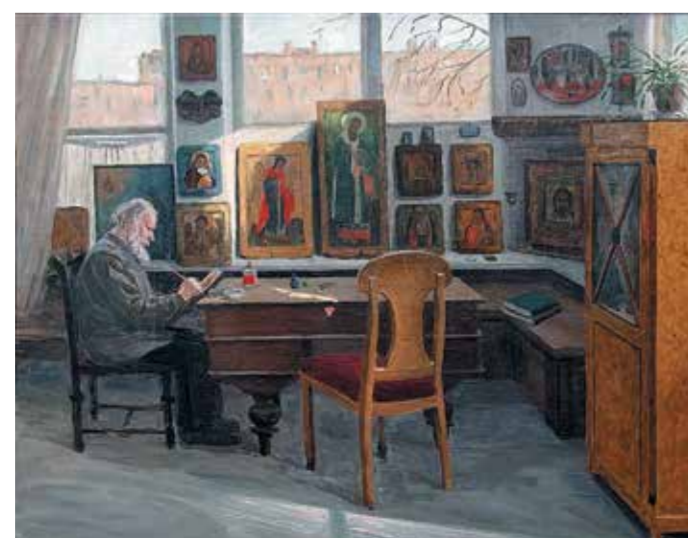
Г. Цыпловский-Ташный. «В мастерской». 2012

В знаменитом выставочном зале МОСХа открылась выставка с созвучным названием «Художник в интерьере». Собираясь на эту выставку, я находился в ожидании большого праздника. И эти ожидания в конечном счёте полностью оправдались. Вся ситуация данной экспозиции заключалась в том, что представленные произведения искусства дают возможность искусствоведам увидеть и понять замысел того или иного автора.