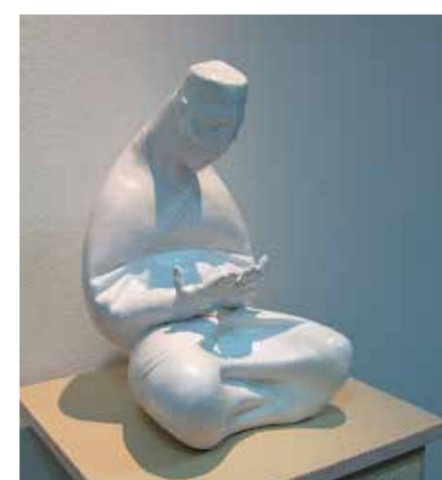
Н. Жуков. «Молитва»