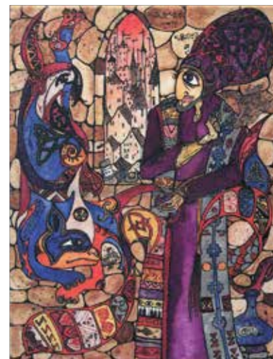
А. Шевцова. Иллюстрация к персидской народной сказке «Злой волшебник»