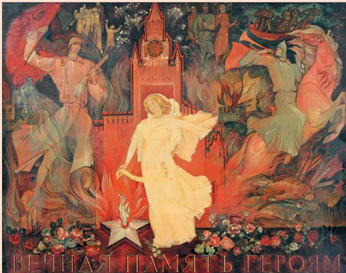
Б. Новоселов. «Вечная память героям». 1979

Так, особыми датами отмечен нынешний год для Федоскино. Это и 215-я годовщина основания здесь промысла лаковой миниатюры, и 100-летие организации артели, и 50-летие создания фабрики миниатюрной живописи.