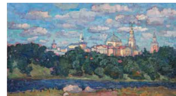
Н.П. Желтушко. «Борисоглебский монастырь в Торжке». 2015