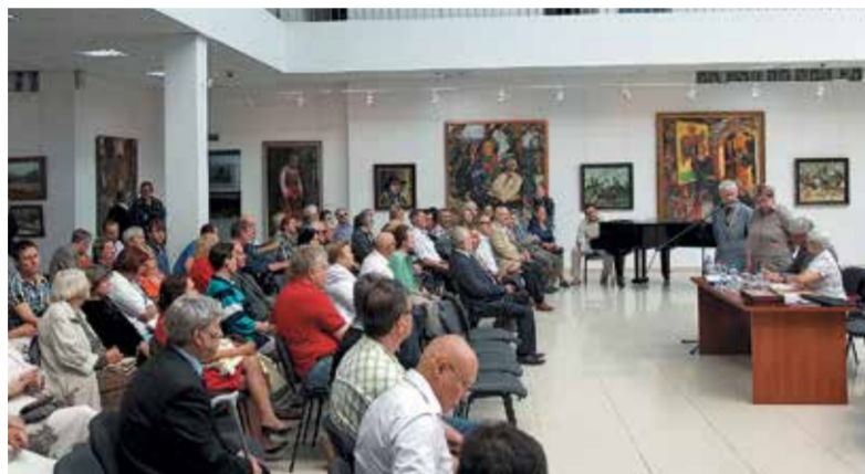
Работа XVIII съезда художников Чувашии