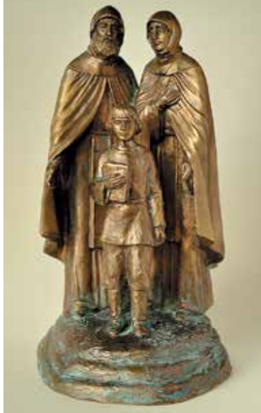
«Кирилл, Мария и отрок Варфоломей». 2015

можно утверждать, что с этого дня все молодые пары будут приходить к этому монументу, класть к его подножию цветы и давать клятву любви и верности друг другу.