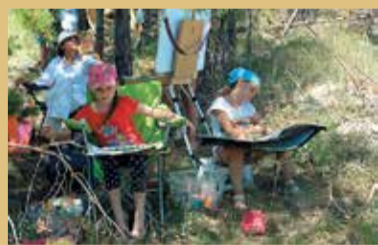
Эстады. Детско-юношеский пленэр им. П.А. Маскова. 2015

По итогам пленэра специальными сертификатами были отмечены все участники и преподаватели.