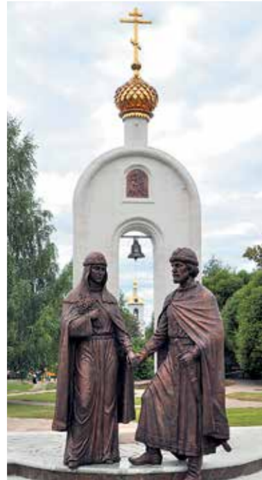
«Петр и Февронья». 2012