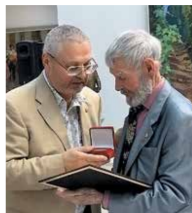
Награждение секретарем СХР В.П. Полотновым народного художника России Р.Ф. Федорова