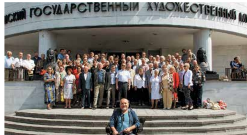
Участники XVIII съезда художников Чувашии

В июле этого года в залах Чувашского государственного художественного музея состоялся XVIII съезд регионального отделения «Союз художников Чувашии» Всероссийской творческой общественной организации «Союз художников России».