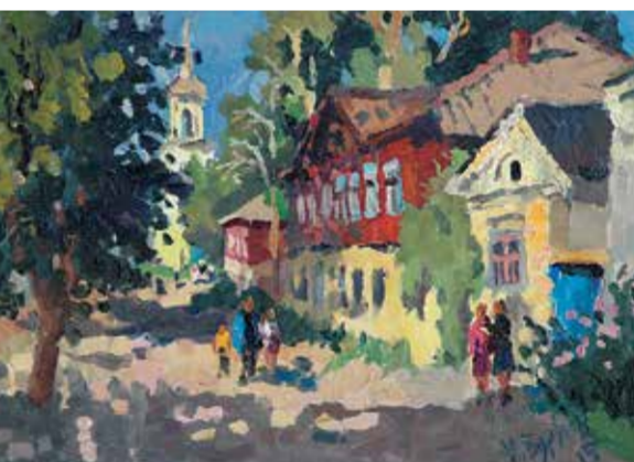
Н.В. Буртов. «Красная горка в Торжке». 2015

старинный дух, что исчерпать сюжеты для городских пейзажей невозможно.