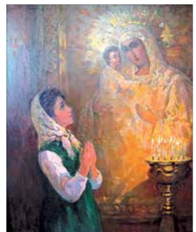
«У иконы Владимирской Богородицы». 2000

и во всеюсоюзных. Без преувеличения можно сказать, что его работы всегда воспринимались с большим интересом и давали возможность зрителю погрузиться в мир величественной русской природы или про-