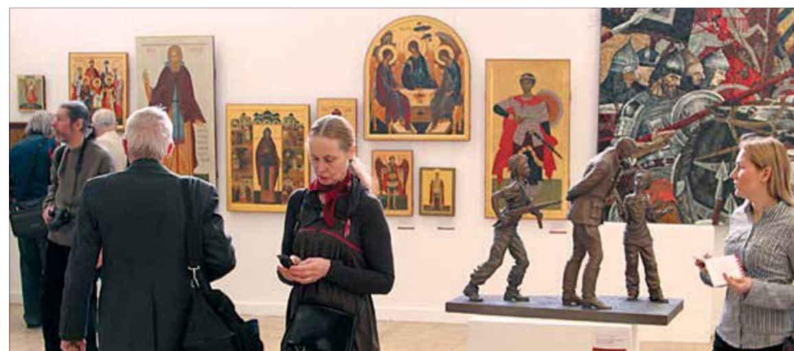
В залах выставки, раздел храмового искусства