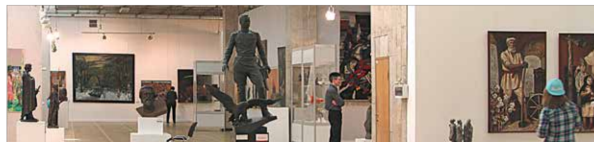
В залах выставки