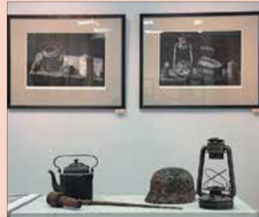
Фрагмент экспозиции областной художественной выставки «За Родину!»

В Тверском городском музейно-выставочном центре состоялось открытие выставочного проекта Тверского областного отделения Союза художников России «За Родину!», посвященного 70-летию Победы в Великой Отечественной войне.