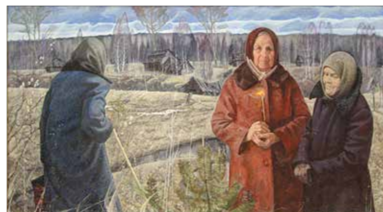
А. Ляшков, «Прощеное воскресенье (Последняя память)». 2010–2012