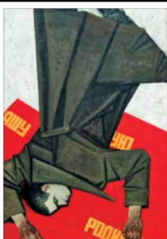
В. Грач, «Первая атака». 2012