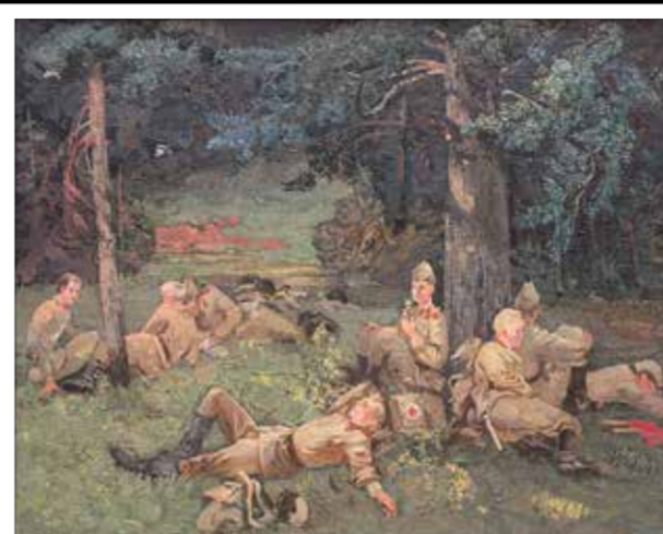
Н. Боровской, «Тишина». 1987