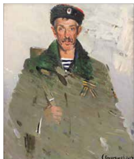
С. Кондрашов, «Ополченец, Позывной Аббат». 2014