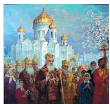
«Русь Святая». 2000

чувствовать красоту написанных им натюрмортов. Как любой талантливый художник, он одинаково уверенно чувствует себя в различных видах и жанрах изобразительного искусства. Нередко на выставках зритель мог видеть его проникновенные портреты, в которых автор сумел раскрыть внутренний мир и характер портретируемого. Блестяще владея цветовой палитрой, художник создавал правдивые образы интересных для него людей. Он никогда не искал легких путей в искусстве, а всегда придерживался искренней правдивости и ответственности перед своим зрителем. Отдавая дань уважения этому талантливому мастеру, вокруг него всегда собиралась творческая молодежь. До сих пор кисть Константина Александровича легко и свободно движется по холсту, создавая работы, которые восхищают зрите-