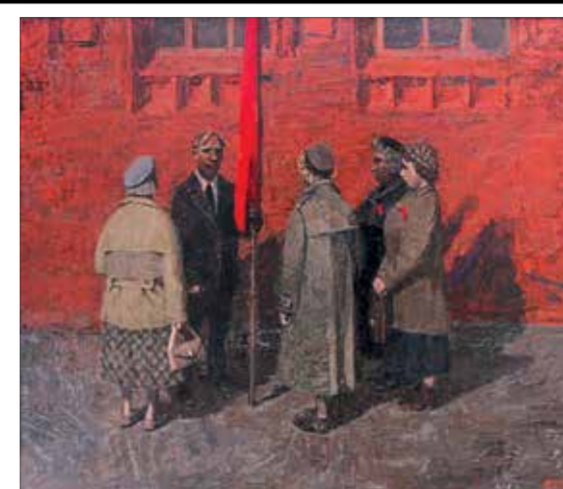
С. Гавриляченко, «Последние верные». 2014