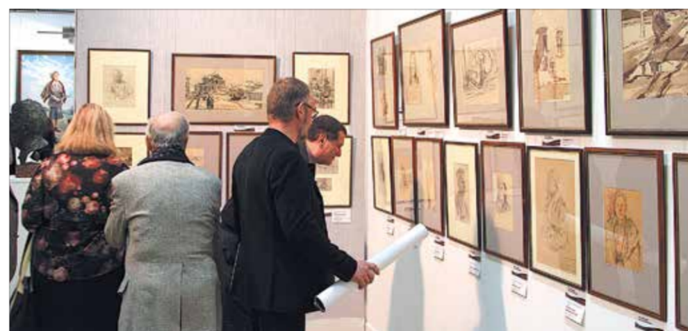
В залах выставки, фронтальные рисунки