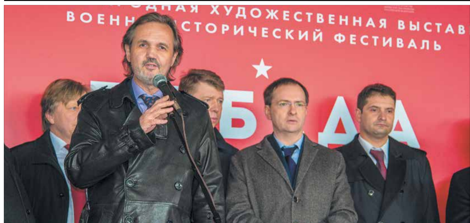
Торжественное открытие Международной художественной выставки «Победа!»