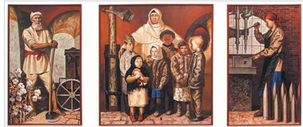
С. Рахметов, «Годы испытаний. Триптих». 1990